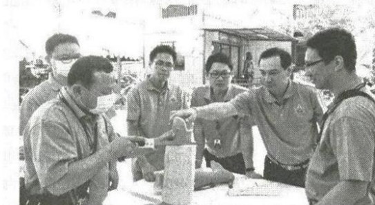
เรียนรู้และช่วยกันทำ