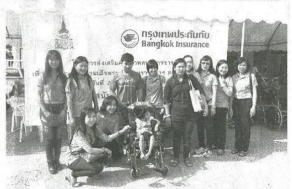
รถใหม่คันใหญ่ นำใจจากพี่ๆ BKI ทุกคน