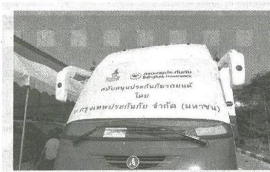
รถบริการทำแซน-ชาเทียมเคลื่อนที่