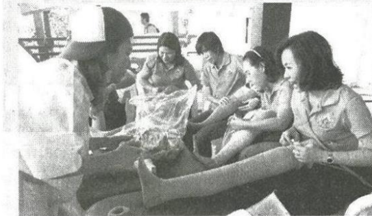
ถุงมือ นอกจากจะเป็นส่วนประกอบทำชาเทียมแล้ว ยังทำให้ คูเรียนเนียนสวยเข้ากับสีผิวอีกด้วย