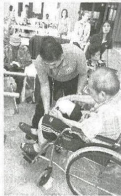
ทดลองใส่ กระชับดีหรือไม่ครับ คุณลุง

บริษัท กรุงเทพประกันภัย จำกัด (มหาชน) หรือ BKI ร่วมกับมูลนิธิศูนย์สิรินธรเพื่อการฟื้นฟูสมรรถภาพทางการแพทย์แห่งชาติ ร่วมทำความดีในกิจกรรมช่วยเหลือและดูแลผู้พิการทางการเคลื่อนไหวที่ไม่สามารถช่วยเหลือตนเองได้ โดยครั้งนี้ผู้บริหารจิตอาสากรุงเทพประกันภัยกว่า 20 คน เข้าร่วมกิจกรรม โดยให้ความช่วยเหลือในด้านต่างๆ ได้แก่ เช่นรถเข็นหรือช่วยพยุงไปยังจุดบริการต่างๆ ช่วยเหลือขณะทดลองใช้ขาเทียมช่วยใส่ถุงน่อง ทำความสะอาดบ้าน/ขาเทียม และตัดซื้อ เป็นต้น เมื่อวันศุกร์ที่ 27 มีนาคม 2558 ณ ศาลาประชาคม เทศบาลเมืองชลบุรี จ.ชลบุรี